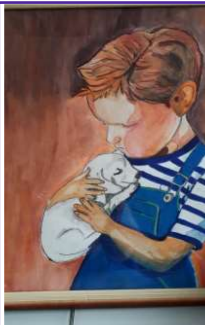
Tableau peint par Violette MOURoux