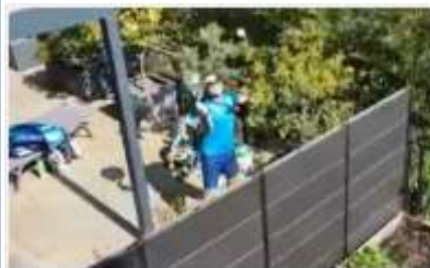
INSOLITE Confinés, un prof de tennis et son voisin s'affrontent par-dessus un mur

Une mère donne naissance à des jumeaux en Inde et les prénomme... Corona et Covid, en souvenir du confinement qu'elle a vécu